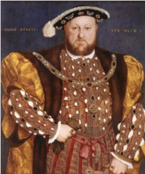
El Rey Enrique VIII de Inglaterra

Bajo el Rey Enrique VIII y sus consejeros Venecianos/Magyar (Húngaros), las primeras leyes de pobres fueron promulgadas alrededor del 1.535 coincidiendo con el primer mandato oficial requiriendo mantención de registro uniforme por toda parroquia de la Iglesia de Inglaterra de nacimientos, muertes y matrimonios.