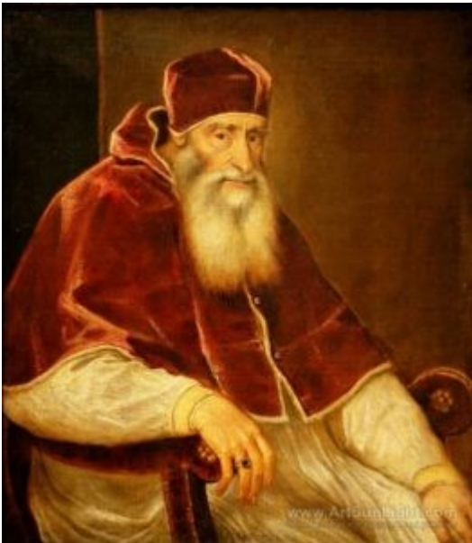
Papa Pablo III