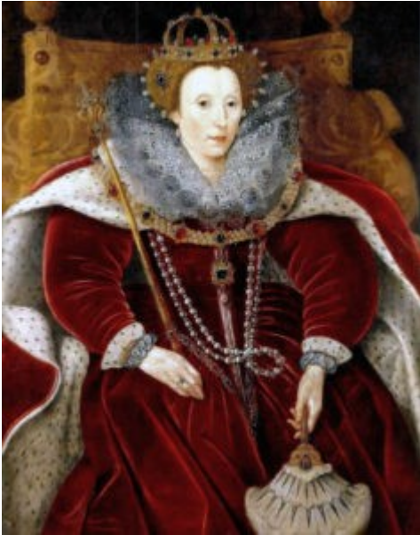
La Reina Elizabeth I de Inglaterra

Bajo la Reina Elizabeth I de Inglaterra, un conjunto de medidas que fueron introducidas y que tuvieron el efecto de acelerar la enajenación de la tierra, de campesinos hacia mendigos sin tierra.