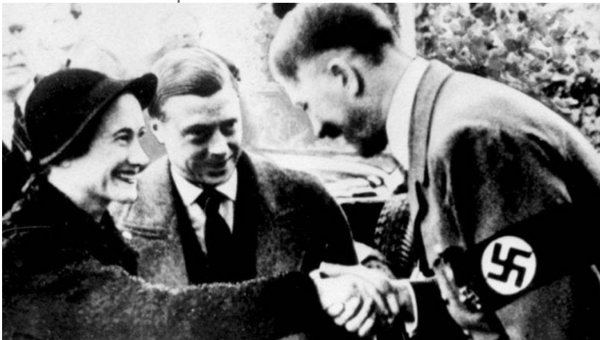
El Duque Eduardo de Windsor pasó a ser conocido Eduardo VIII luego de abdicar al trono, se reunió con Hitler en 1937.