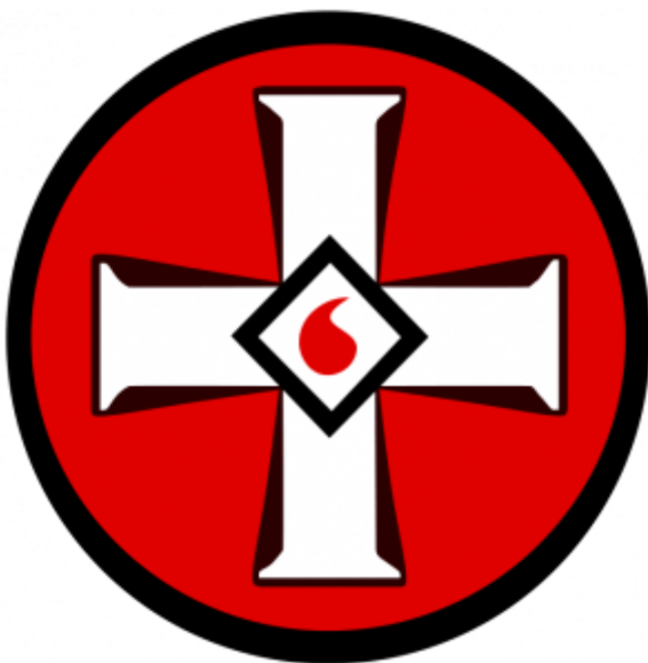
Logo del Ku Klux Klan

David Duke , el ex Gran Mago del KKK, fue a la Universidad de Louisiana en Baton Rouge aproximadamente al mismo tiempo en la década de 1960 en que el príncipe alemán Andreas de Sajonia-Coburgo y Gotha se educó allí.