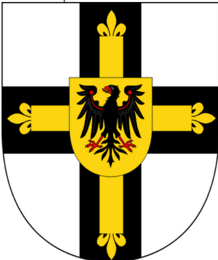
Escudo de la Orden Teutónica con el águila mirando al Oeste.

Los nazis son supremacistas espirituales y tecnológicos fundados originalmente en Alemania por ocultistas y miembros de la Sociedad del Sol Negro y la Sociedad Thule y están conectados con los Caballeros Teutónicos , que son caballeros cruzados cristianos como los Templarios.