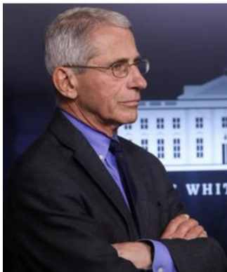
Dr. Anthony Fauci

El encubrimiento de Wuhan explica el fraude de las armas biológicas y su relación con las vacunas