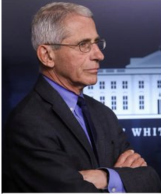
Dr. Anthony Fauci