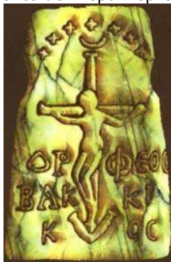
Reproducción de una piedra gnóstica representando a Orfeo en la cruz.

Crucifijo precristiano, procedente del Nepal representando a Indra crucificado.