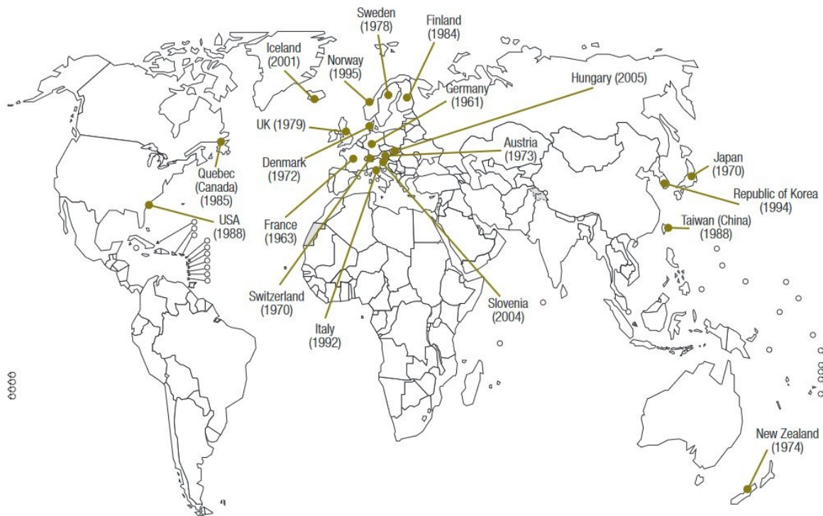
Fig. 1. Countries and provinces that have introduced vaccine-injury compensation schemes (including year of introduction)

UK, United Kingdom of Great Britain and Northern Ireland; USA, United States of America.