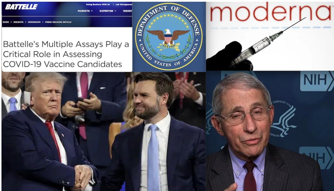
Tabla de contenido