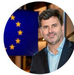
Nicolás González Casares MEP Member, ENVI Committee, Spain