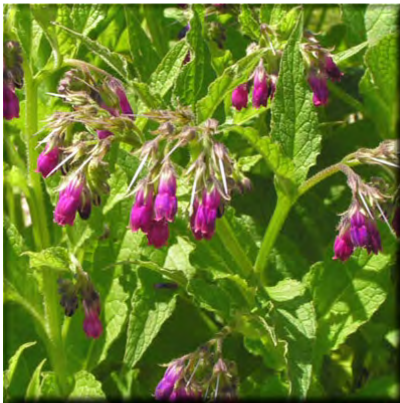
CONSUELDA MAYOR ( Symphytum officinale )

Cataplasmas de plantas frescas: Cola de caballo recién cogida se lava y se pica en el mortero hasta que se forme a modo de una papilla.