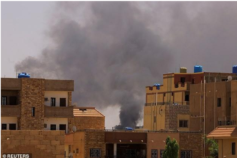
Se ve humo saliendo de los edificios durante los enfrentamientos entre las Fuerzas de Apoyo Rápido paramilitares y el ejército en Jartum Norte, Sudán, el 22 de abril de 2023.

Un alto el fuego de 72 horas negociado por Estados Unidos entre los generales en guerra de Sudán entró oficialmente en vigor el martes después de 10 días de combates urbanos que mataron a cientos, miles de heridos y provocaron un éxodo masivo de extranjeros.